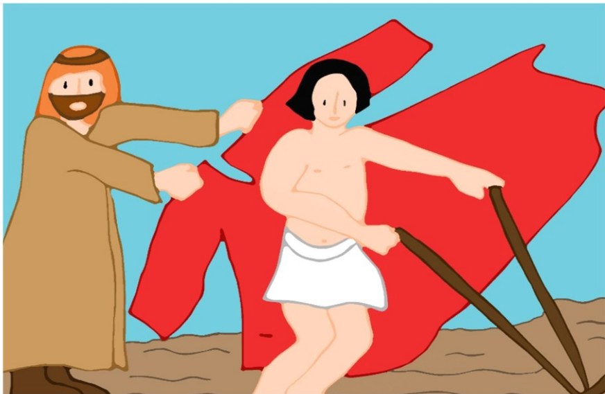
Elie appelle Elisée

Colorie ou coche avec une croix dans les deux images en noir et blanc ce qui se ressemble. Dis ce qui est différent.