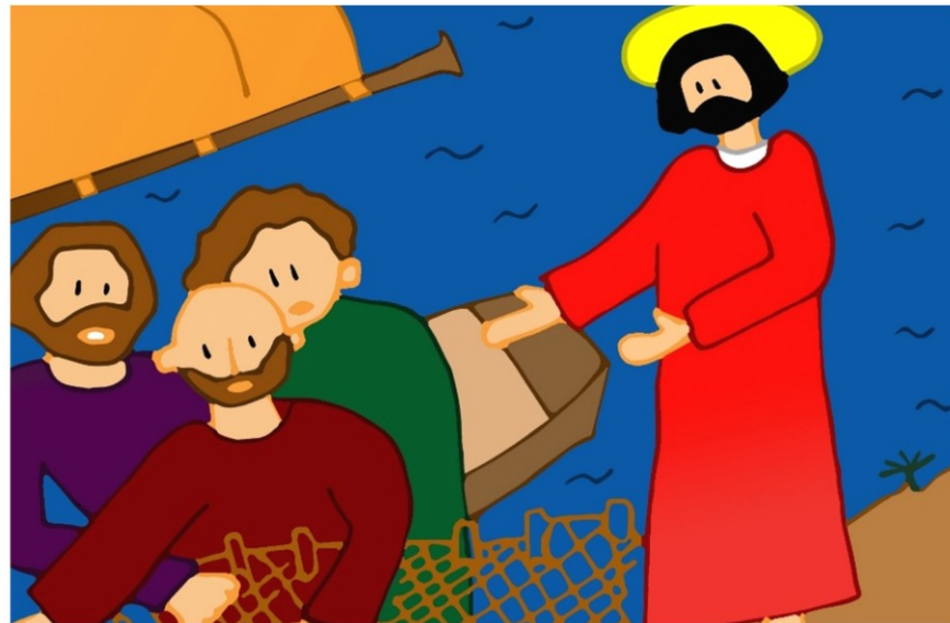
Jésus appelle des pêcheurs