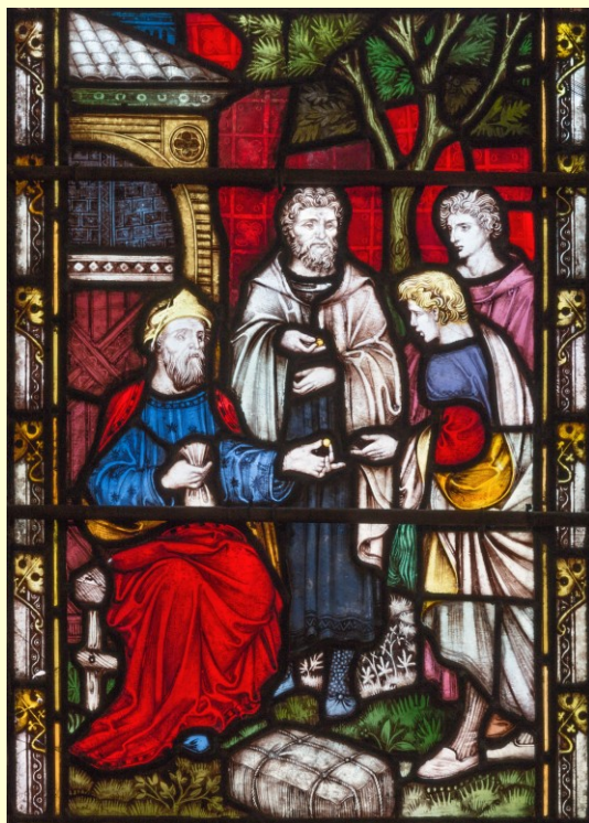
Vitrail Église St Mary abbé de Kensington High Street Londres