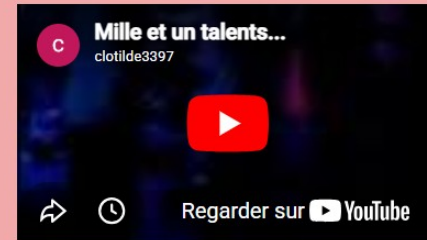
Mille et un talents par des jeunes