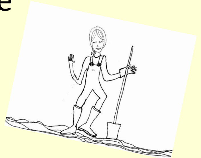
Bande dessinée - Parole des talents - Averbode

Une fiche pédagogique Des récits adaptés à chaque âge Des BD Des coloriages